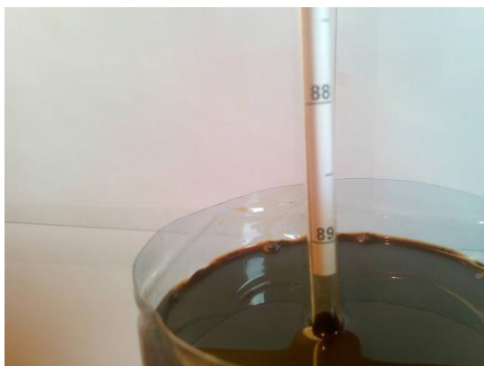
Olja från JU-1.

Geofysikernas åsikter avseende mättnadsinnehållet i denna formation var delade, en grupp trodde på vatten och en grupp ansåg att formationerna är oljemättade. Tre formationer med en total tjocklek om 8 meter (2+3+3 m) perforerades och inflöde av olja med en densitet om 0.9 g/cm 3 konstaterades. Oljans densitet ligger inom specifikationerna för en "Siberian Light Crude", precis som oljan från JU-5. Oljan är av en mörkbrun färg med en grönaktig ton.